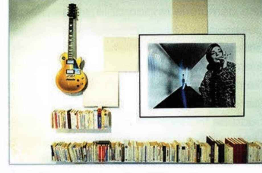
Panneaux acoustiques PYT Audio